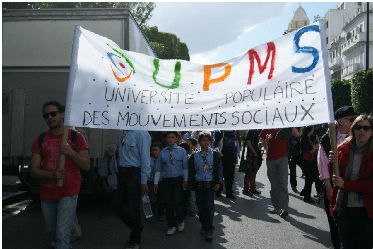
Imagen de la participación de la UPMS en la marcha del Foro 2013

En mayo de 2013 se confirmó la concesión de una subvención de la Coordinadora para la Mejora del Personal de Enseñanza Superior (CAPES) a IGM, según informó FM a BSS por correo electrónico: